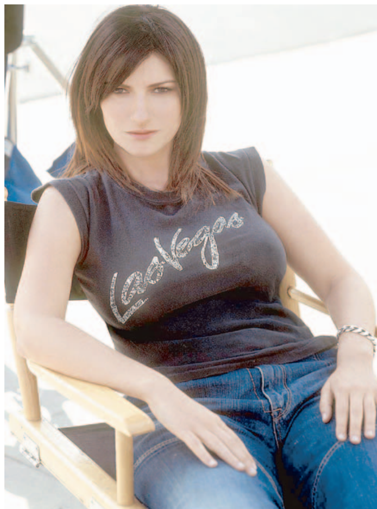
Laura Pausini in prova: per ascoltarla arriveranno in 70 mila

MA SONO tanti gli schermi su cui i quasi 70 mila fan – che hanno acquistato con largo anticipo i biglietti – potranno seguire ogni mossa dell'artista: sullo sfondo del palco sono previsti 300 metri di «mistrip», strisce di schermi per effetti grafici e, ai lati del palco, altri due schermi da 40 metri quadrati l'uno. «È la prima volta che un artista italiano utilizza questa tecnologia», aggiunge il produttore. «Prima della Pausini è stato appannaggio di cantanti del calibro di George Michael e Bon Jovi».